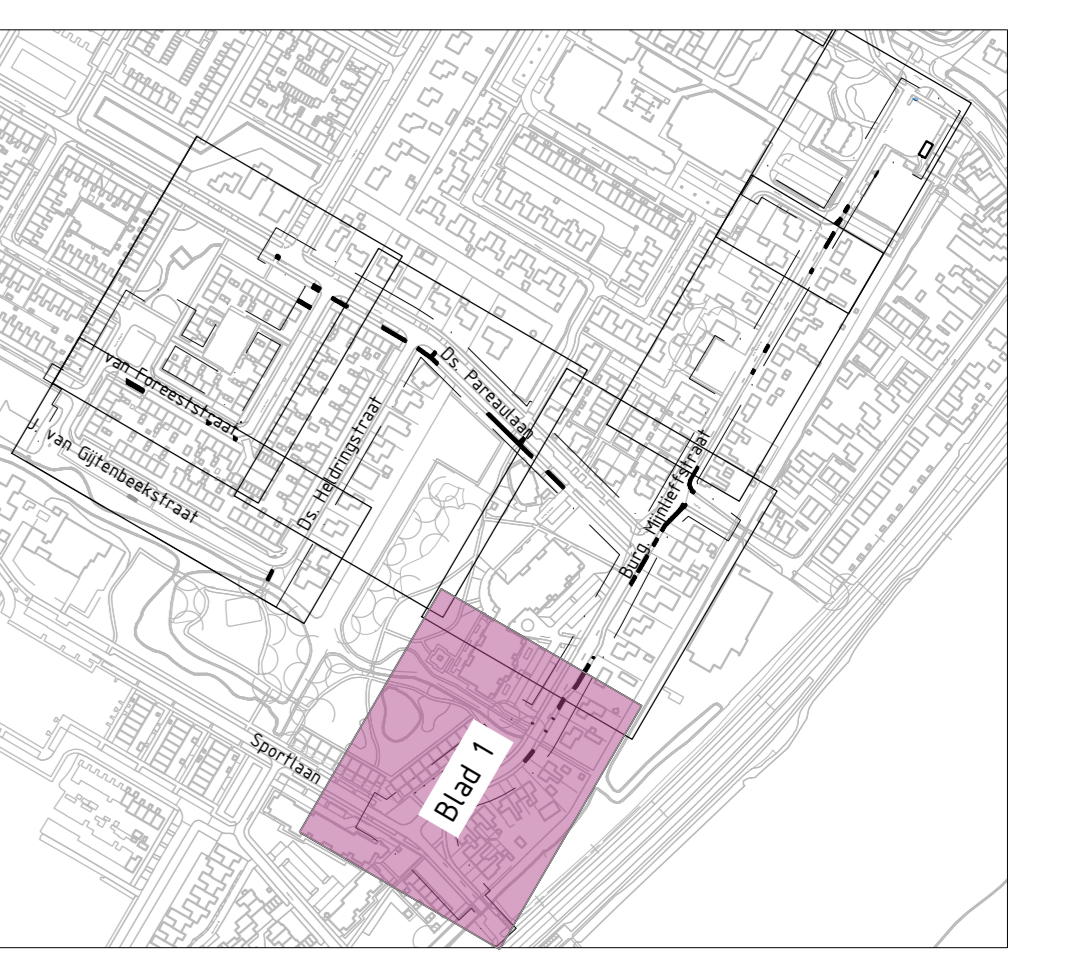
Overzicht bladindeling Schaal 1:5000